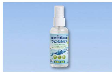
強力除菌・消臭水「ウインカムケア」 ミニスプレー60ml 900円+消費税