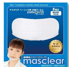
透明衛生マスク「マスクリア」 交換フィルム(メッシュ) 2,140円+消費税