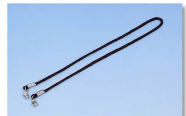
透明衛生マスク「マスクリア」 ネックストラップ(5本入) 1,200円+消費税

2010年7月に発売を開始した、「透明衛生マスク マスクリアシリーズ」から新機能によりさらに使いやすくなったNEWモデルを新発売いたします。今回は、ユーザーからのご要望の多かった箇所を改良を加え、大幅にリニューアルをし、半透明タイプの交換フィルム(メッシュ柄タイプ)も新たに追加して発売いたします。