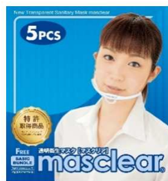
透明衛生マスク「マスクリア」 ベーシックバンドル 8,000円+消費税