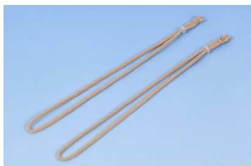
透明衛生マスク「マスクリア」 交換バンド(10セット入) 2,000円+消費税