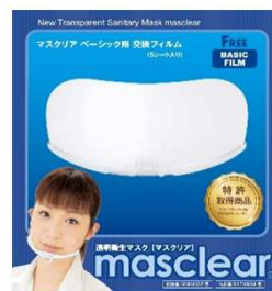
透明衛生マスク「マスクリア」 交換フィルム(クリア) 2,140円+消費税