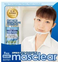
透明衛生マスク「マスクリア」 ベーシック 1,880円+消費税